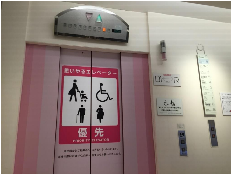
図2 優先利用のペイント

女性の生き方ブログ：50代を丁寧に生きる、あんさん流 by Ameba 優先エレベーターのマナーの正解は？ < https://ameblo.jp/aroundfifty50/entry-12370068101.html > 2018年5月28日アクセス